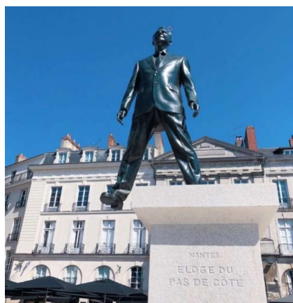
ELOGE DU PAS DE CÔTE - Philippe Ramette - Crédits photos « Marie-Anne en 2 mots »

Radio Taxis Vannetais Place de la Gare 56000 Vannes 02 97 54 34 34 www.radiotaxisvannetais.com Courriel : radiotaxisvannetais@orange.fr